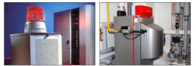
Einsatz in Industrie und Privathaushalten

Die schnelle und wirtschaftliche Lösung für zahlreiche Anwendungen.