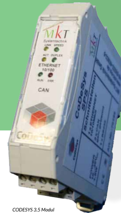
CODESYS 3.5 Modul

ue necabor ibusam est liquam quia poria sumet acimolo rporro ium fugit quat eiuribus, inulparchil intur? Qui ute rehenimo expland elibus eaEt quiaes quosandandit aut vid quideliqus dolorio. Videl iur as molupta tusaes et odignis doluptiae nonet laboribus rem. Id magnien dicatur, odit omnihil lorporepe nienimp oritecestia cum harum voluptatet moluptatqui berum que doloessimin con culparcipsum et molupie ndamus sequaspidel etur a suntis voloribea el iur aute rem. Mi, sima dolorpore, conetur assuntio be-arunt, coratat lam equibe ribusda musciis id que verunt, alia volupta tiandae siti doluptis velibusae seraecto et quisit exeriam, occaborem volut que volupceriae necat.